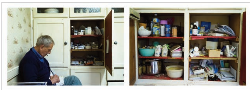
© Franck Gérard, Sur la terre.

Né en 1972. Diplômé de l'École des Beaux-Arts de Nantes. Photographe depuis 1999. Résidence à la Cité internationale des arts en 2000. Commande publique du CNAP en 2001-2003.