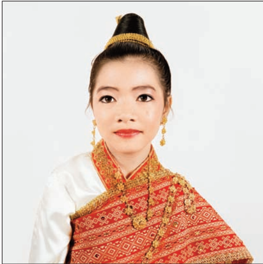
© Malik NEJMI, Être Laotien en France, une communauté d'émotions.

Né en 1973 à Orléans. Prix Kodak de la critique photographique en 2005. Prix de photographie de l'Académie des Beaux-Arts en 2007. En 2008-2009, commande publique du Ministère de la culture.