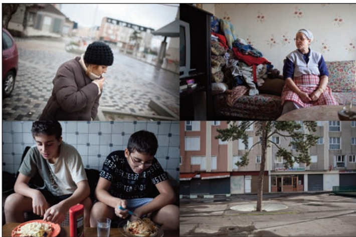
Chanteloup. Récits de banlieue. Portraits d'une cité.

Né en 1970. Rejoint l'agence Sipa Press en 1992. Obtient en 2004 le prix Visa d'or et le prix Care International du reportage humanitaire pour « Le Soudan, la guerre oubliée », et le prix Paris-Match pour « Itinéraires clandestins ». En 2007, reçoit le Grand Prix du Festival du scoop d'Angers pour son reportage « Tchad-Soudan, l'autre guerre au Darfour ».