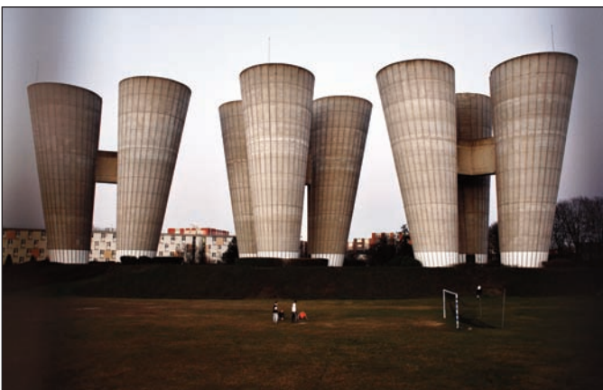
© Cyrus CORNUT, Voyage en Périphérie.

Né en 1977. Français d'origine irano-irakienne Cyrus CORNUT a d'abord suivi des études scientifiques puis d'architecture. Installé à Paris après avoir vécu à Bagdad et au Caire. Se consacre à la photographie depuis 2005.