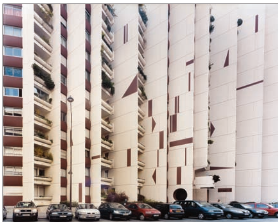
© Gilles LEIMDORFER, Paris face à face.

Né en 1964. Après avoir obtenu son diplôme de droit en 1988, entre à l'AFP en 1988. Rejoint REA en 1992. Intègre l'Agence Rapho en 2001, et Interlinks Image en 2008.