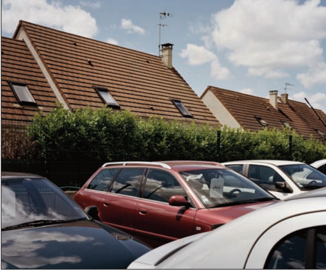
© Julien CHAPSAL, (Où) Suis-je ?

Né à Paris en 1977, obtient une maîtrise de Lettres modernes en 1998 et un DEA en anthropologie visuelle en 2001. Chargé de projets pour Tendance Floue puis Magnum Photoil. Se consacre à des travaux personnels depuis 2001.