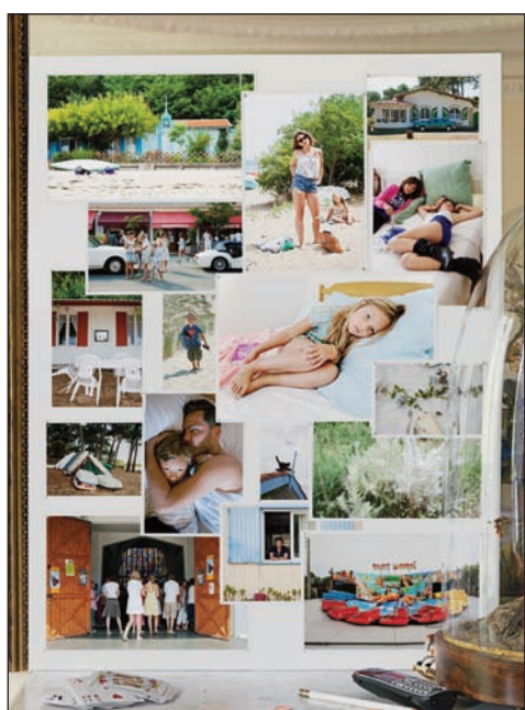
L'hôtel de la plage.

Né en 1959 à Issy-les-Moulineaux. Vit et travaille à Paris. Photographe depuis une vingtaine d'années. Se consacre également à la vidéo et à la réalisation de films documentaires pour la télévision.