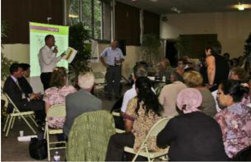
Réunion publique sur l'aménagement de la Montagne des Glaises, le 28 juin 2011.