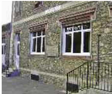
L'école élémentaire Théodore-Steeg.