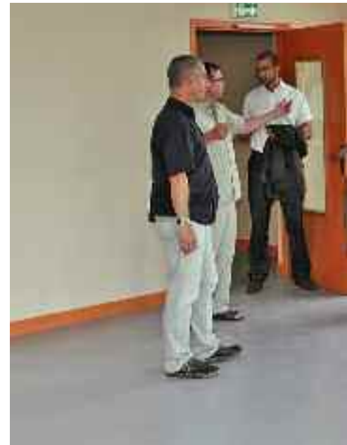
L'école élémentaire Pressoir-Prompt.

La plupart des écoles de Corbeil-Essonnes bénéficie chaque année de nombreux travaux de rénovation. Focus sur huit chantiers terminés.