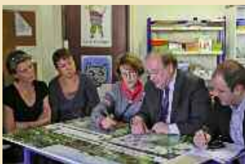
Point d'avancement avec les directeurs des écoles Montagne des Glaises et Picasso sur les futurs plans.