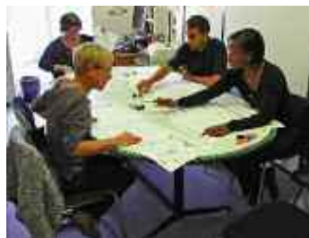
Réunion de travail avec l'équipe de l'Action Éducative.

A l'avenir, je souhaiterais également constituer à nouveau un vivier d'enseignants formateurs à Corbeil-Essonnes car ce territoire diversifié pourrait offrir une expérience pédagogique riche. Des enseignants effectuent un quotidien un travail remarquable et ambitieux pour les élèves, travail qu'il serait bon de partager.