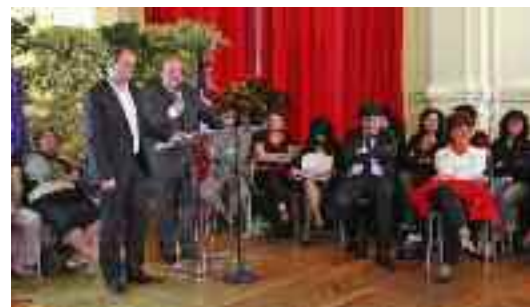
Réunion de travail avec l'ensemble des directeurs des écoles primaires à l'hôtel de ville.

Si je peux me permettre, j'ai un penchant pour la réhabilitation de l'école La Nacelle dans laquelle j'ai suivi toute ma scolarité.