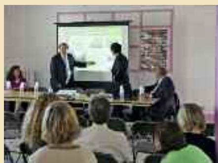
Présentation du projet de la future école Langevin à l'équipe enseignante.