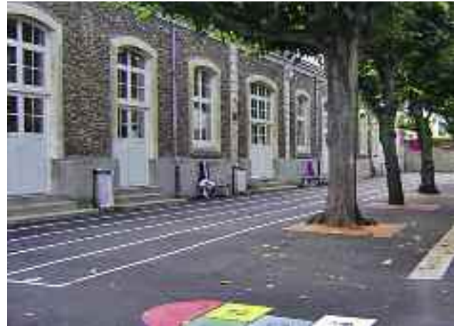
L'école élémentaire Jules-Ferry.

L'école maternelle Jean-Macé a été agrandie ce qui permet de réintégrer la classe transplantée en élémentaire. Un atelier a été créé, tout comme une salle pour les ATSEM et de nouveaux sanitaires. Au premier étage et dans le bureau de la directrice, les fenêtres ont été changées. Le dortoir a bénéficié d'isolant sur les murs et de nouvelle peinture. Les fenêtres et porte-fenêtre ont été remplacées. Le dortoir est dorénavant totalement isolé. La toiture a, quant à elle, été réparée et la couverture du kiosque, net-