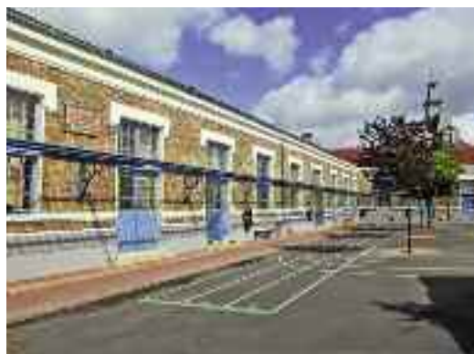
L'école élémentaire Paul-Bert.