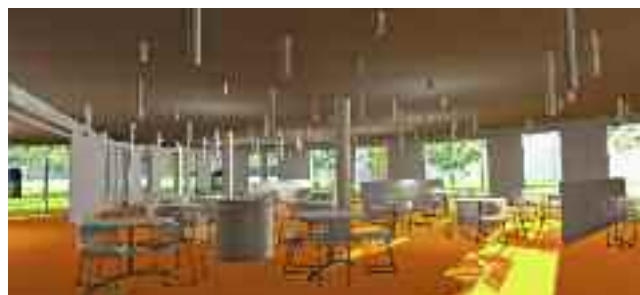
Projet de future restauration.

L'école élémentaire Paul-Eluard va être réhabilitée dans l'optique de réintégrer les classes qui sont actuellement transportées à l'école Langevin. L'école maternelle La Source sera elle aussi réhabilitée mais également étendue. Ainsi, les classes transportées à l'école Paul-Eluard pourront revenir dans cet établissement et le dortoir sera agrandi. Un réfectoire, sur le modèle du « self à grandir » sera créé et commun aux deux écoles. Nous sommes actuellement au stade de la concertation, des études et du diagnostic. Cependant, les travaux débiteront en janvier 2013 et devraient se terminer un an plus tard.