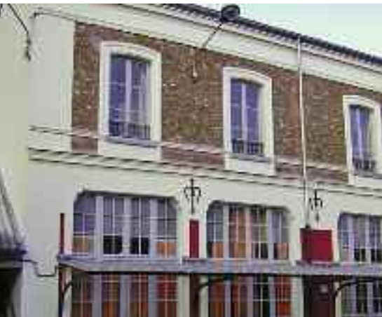
L'école élémentaire Jacques-Bourgoin.

Comme chaque année et toujours dans l'optique de permettre aux écoles possibles, plusieurs écoles ont été rénovées pendant les congés d'été.