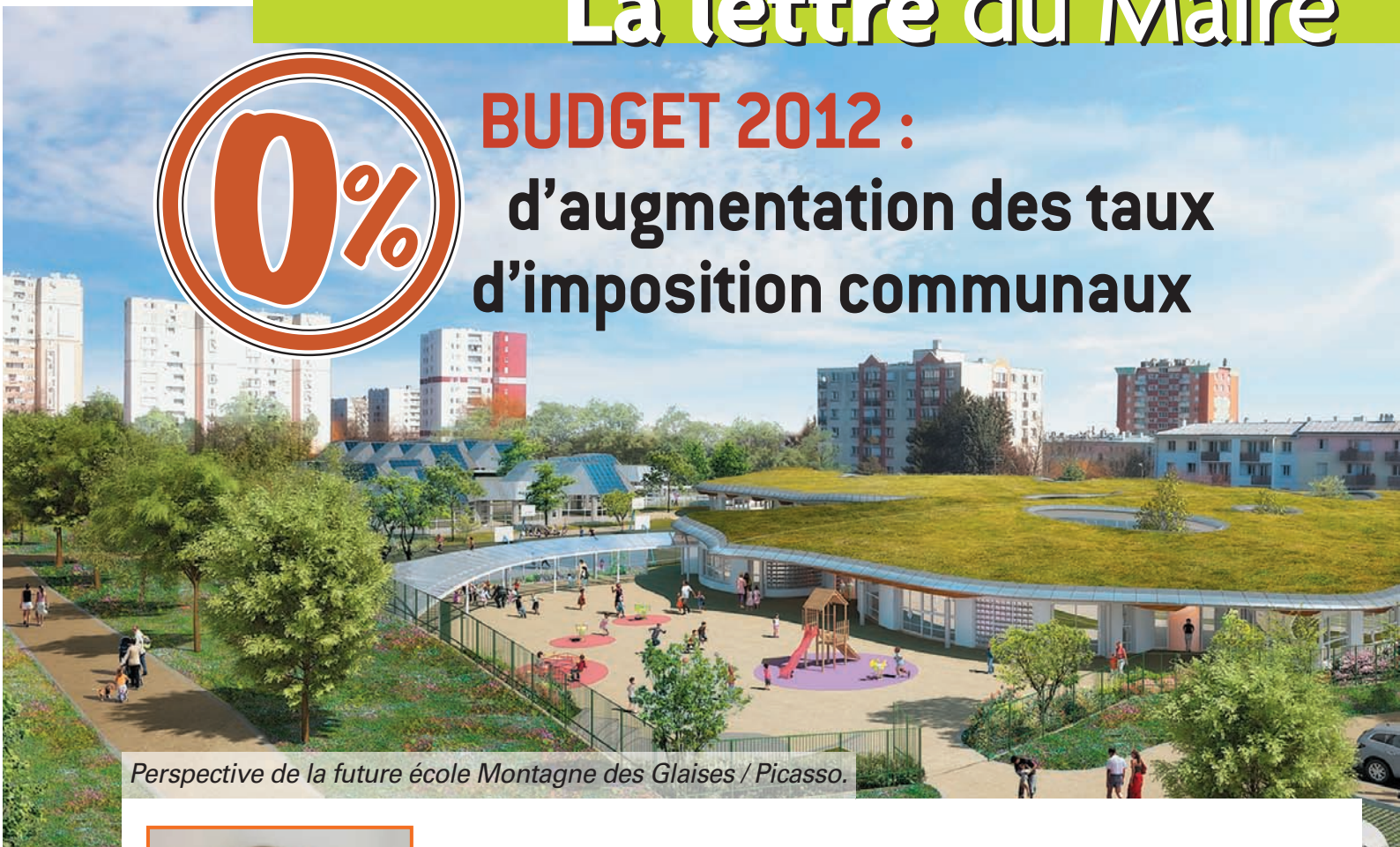
Perspective de la future école Montagne des Glaises / Picasso.