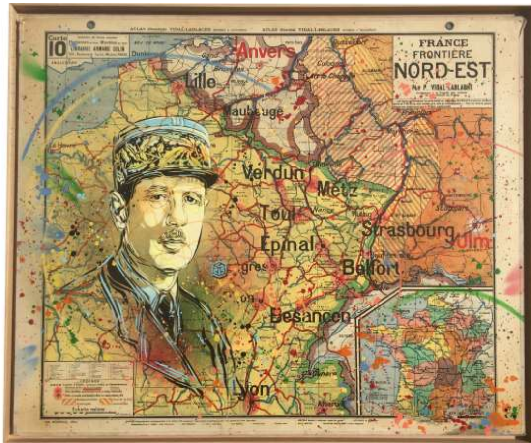
C215 – Epilogue 98 x 118 cm Pochoir sur carte scolaire