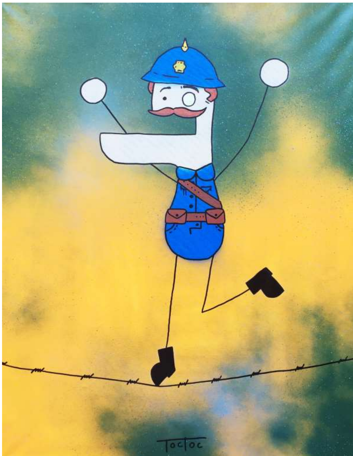
TOCTOC – Le funanbule Duduss 90 x 70 cm Bombe aérosol et acrylique

Exposition réalisée par la Ville de Corbeil-Essonnes – Service Arts et Expositions.