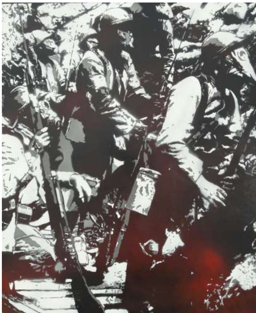
BEN SPIZZ – Les tranchées 48 x 40 cm Pochoir et acrylique

https://www.facebook.com/Le-Lavomatik-arts-urbains-1397962470468246/?fref=ts