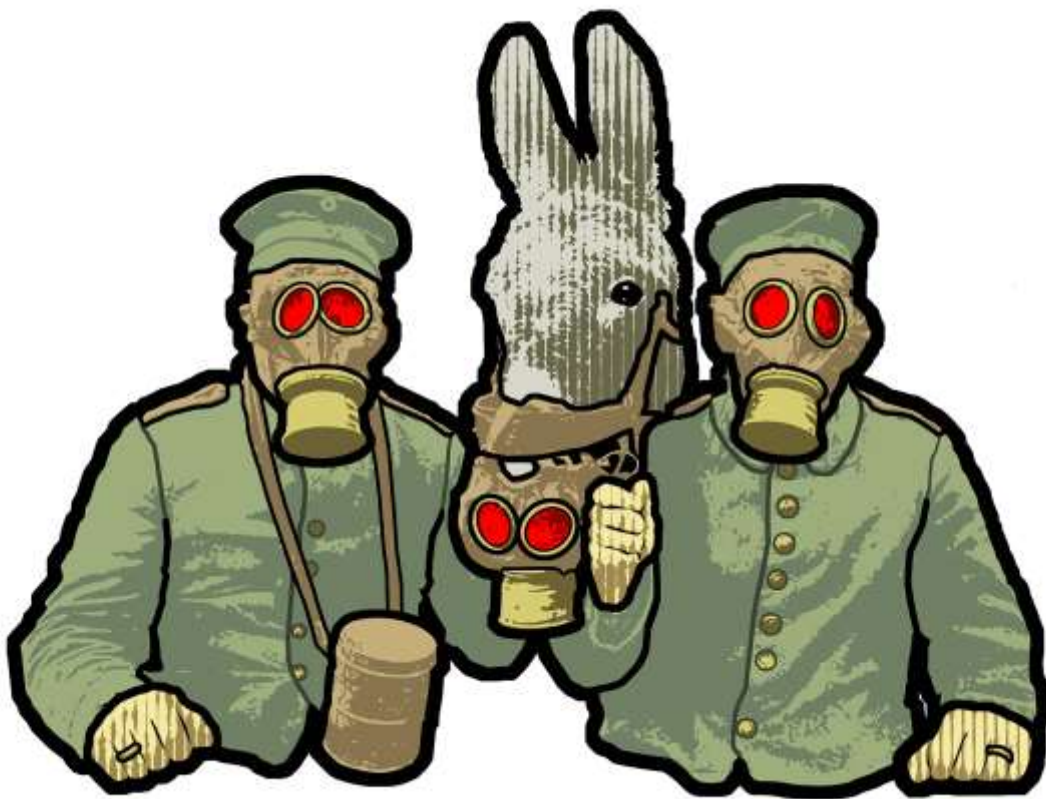
JBC – Gaz 120 90 cm Acrylique sur bois