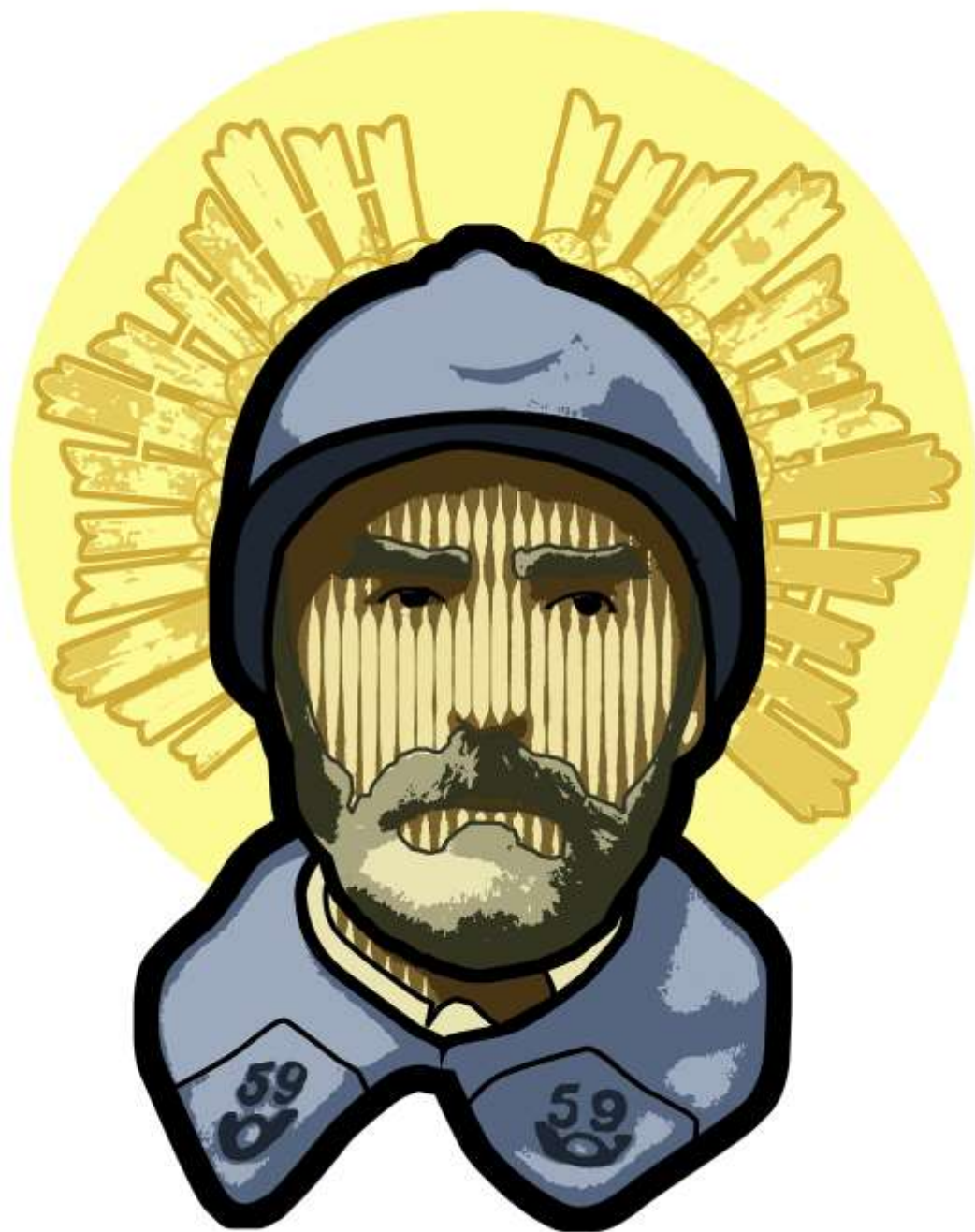
JBC - Poilu 80 x 60 cm Acrylique sur bois