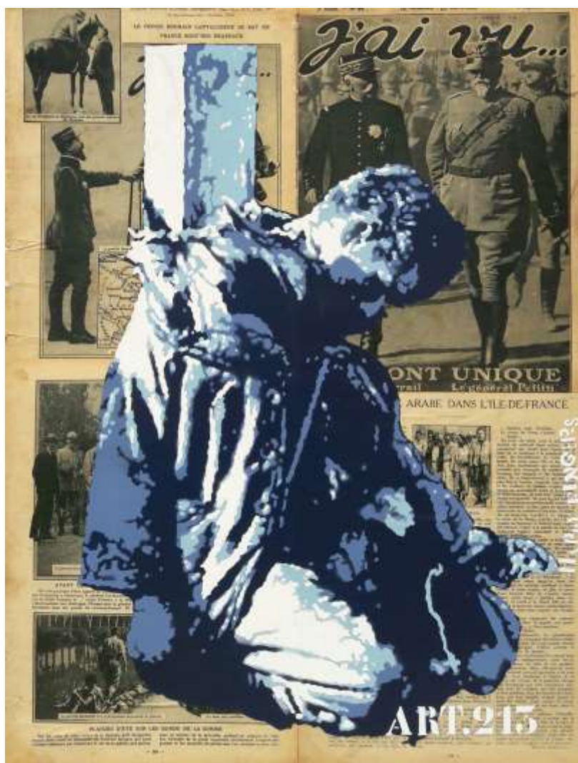
HAPPY FINGERS – Article 213 65 x 50 cm Collage et pochoir, acrylique